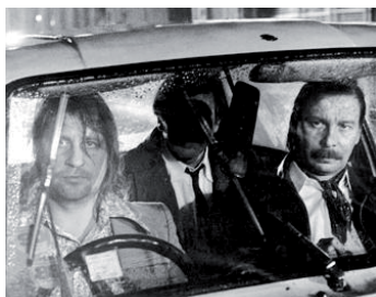
PROJEKT 100 15. 3. Bohémský život

Mezinárodní festival dokumentárních filmů JEDEN SVĚT – 14. ročník (ve spol. s o. p. š. Člověk v tísni při ČT) v MKP od 7. – 15. 3. Program projekcí na www.oneworld.cz www.clovekv tisni.cz www.mlp.cz